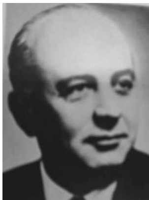
Obr. 1: Ladislav Hrdina