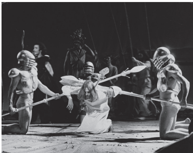
Obr. 4: Ježišovo zatknutie (prvé divadelné uvedenie, 1971)