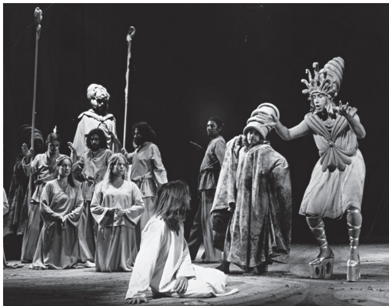
Obr. 2: Ježiš a Herodes (prvé divadelné uvedenie, 1971)