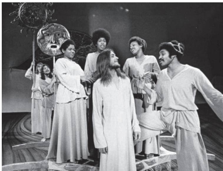
Obr. 3: Ježiš, Judáš a apoštoli (prvé divadelné uvedenie, 1971)